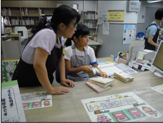
返却された本のバーコードを読み取っています。

はつかいち市民図書館では、7月26日(土)・28日(月)・29日(火)の3日間、4人の子ども司書が実地研修を行いました。