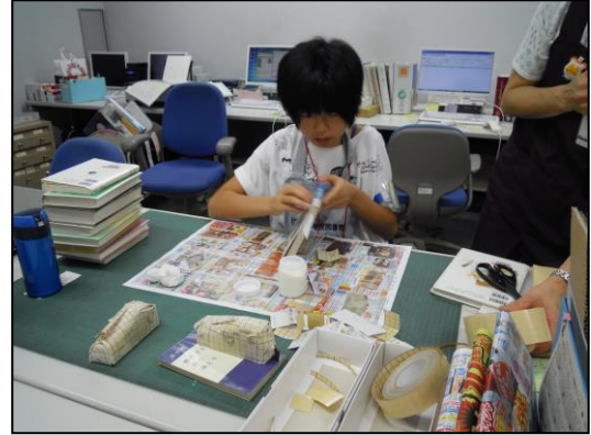
本の修繕をしています。

おはなし会を見学したり、カウンターで返却や貸出を行ったり、返却された本を棚に戻したり、図書館のいろいろな仕事を体験しました。